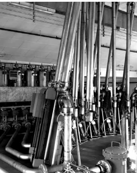
Verladestation mit 12 Verladearmen