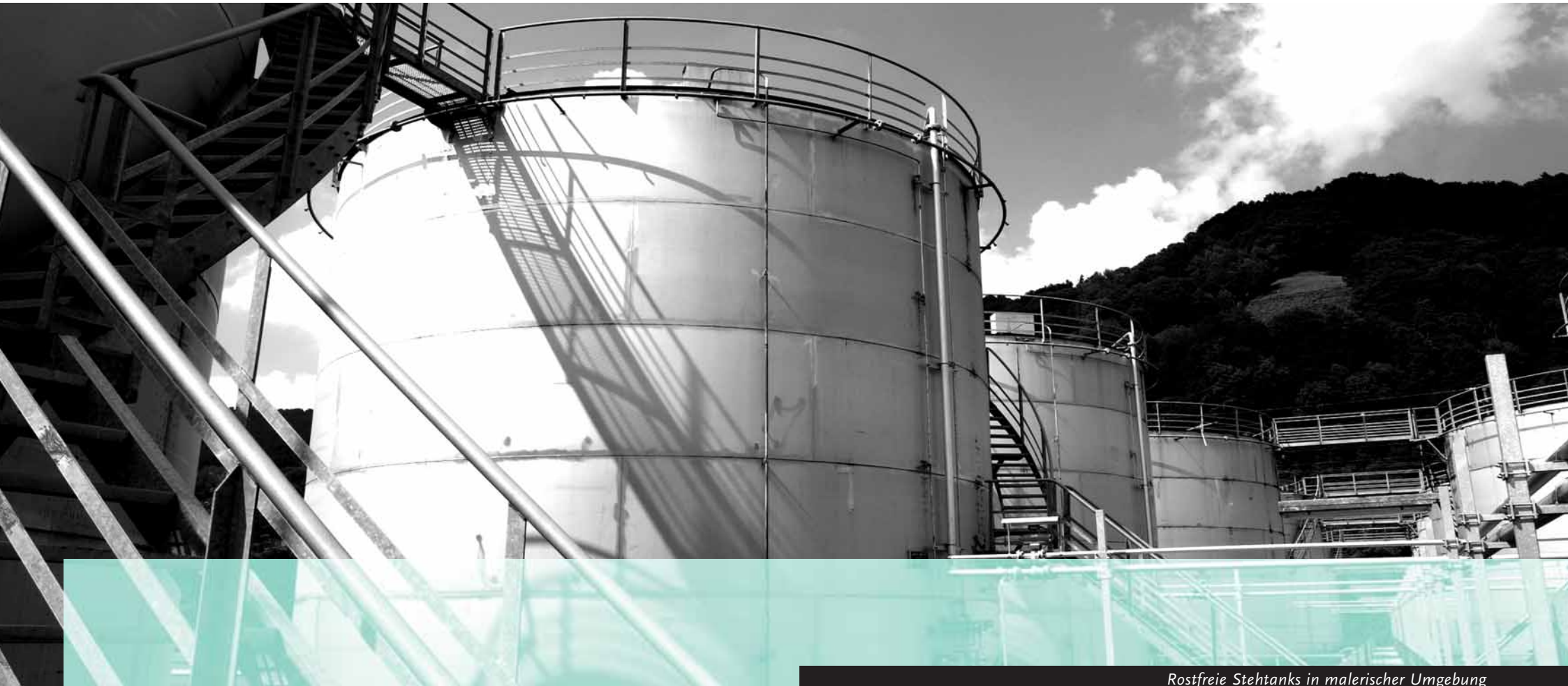
Rostfreie Stehtanks in malerischer Umgebung